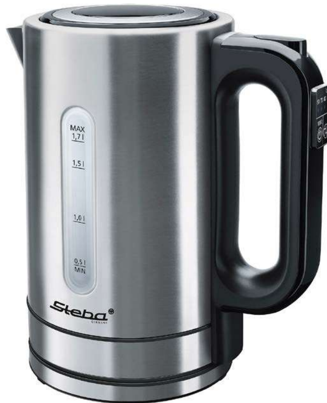
Электрический чайник WK 21 Inox