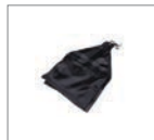
Мешочек для противовеса