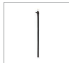
Перекладина 1 шт.