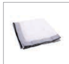
Рассеиватель 3 шт.