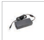
Адаптер 100-240V AC