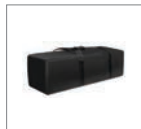
Сумка для переноски и хранения