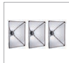
Софтбокс 50x70 см 3 шт.