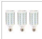
Лампа LED 30W, E27 3 шт.