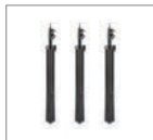
Стойка 200 см 3 шт.